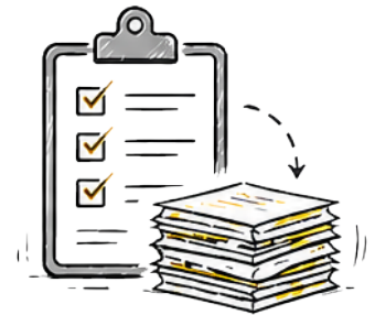
MANUELLE DOKUMENTATION UND MEDIENBRÜCHE

Beim Beladen zählt jede Minute. Stationäre Fahrzeugwaagen liefern verlässliche Ergebnisse und bleiben ein wichtiger Bestandteil der Abrechnung. Im laufenden Betrieb entstehen jedoch oft zusätzliche Wege, Wartezeiten und manuelle Zwischenschritte, die den Materialfluss verlangsamen.