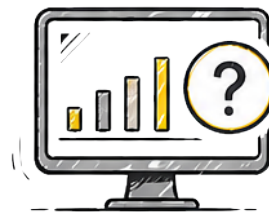
KEINE ECHTZEIT- ÜBERSICHT ÜBER VERLADENE MENGEN