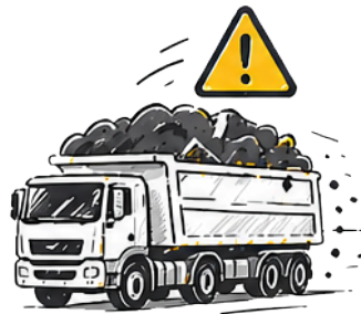
ÜBERLADUNG MIT RISIKO VON STRAFEN UND SCHÄDEN